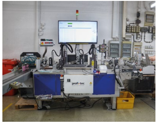
Das Eagle 30 UV-Drucksystem von profi-tec lässt sich in fünf Minuten einrichten und produziert mit höchster Präzision, Zuverlässigkeit und Qualität. Bis zu 10.000 Maxikarten sind pro Stunde möglich.

Darüber hinaus lassen sich nicht nur Adressen drucken, auch in Sachen Grafik bietet das System einige